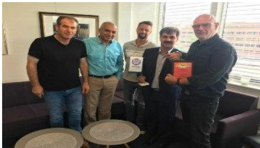
گفتگو و دیدار نمایندگان سندیکای کارگران شرکت واحد و نماینده معلمان - کردستان با رئیس سندیکای ترانسپودت نروژ - اسلو @vahedsyndica