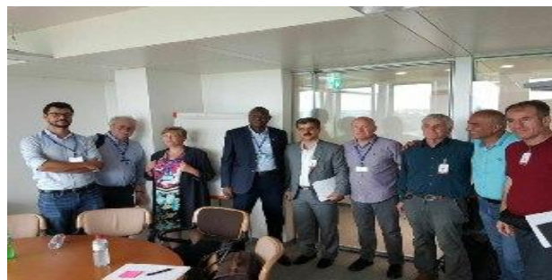
گفتگوی نمایندگان سندیکای کارگران شرکت واحد با آقای ممدو و خانم مبل مسئولین کنفدراسیون بین المللی اتحادیه های کارگری جهان در اجلاس سازمان جهانی کار ژنو با حضور نمایندگان کلکتیو سندیکاهای فرانسه و سوئد

نمایندگان سندیکا در حاشیه اجلاس های ژنو در جلسه مشترکی که با حضور هفت کنفدراسیون کارگری از کشورهای فرانسه، سوئد، ایتالیا و اسپانیا و کنفدراسیون بین المللی کارگران حمل و نقل و کنفدراسیون بین المللی اتحادیه های