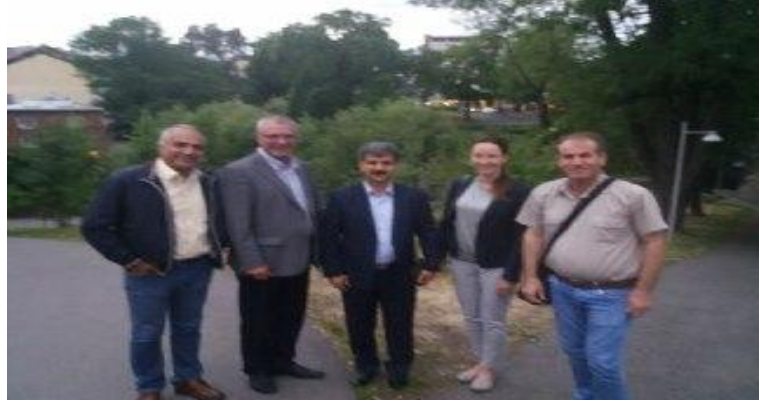
دیدار نمایندگان سندیکای کارگران شرکت واحد و نماینده معلمان کردستان - مریوان، با سندیکای LO و سندیکای معلمان در نروژ - اسلو @vahedsyndica