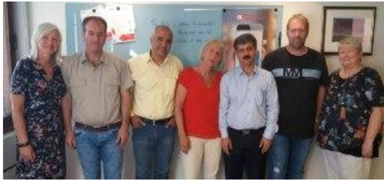
دیدار نمایندگان سندیکای واحد و نماینده معلمان در مریوان با نایب رییس سازمان سراسری اتحادیه کارگری نروژ و خانم کاترین مسنول روابط بین الملل در نروژ. @vahedsyndica