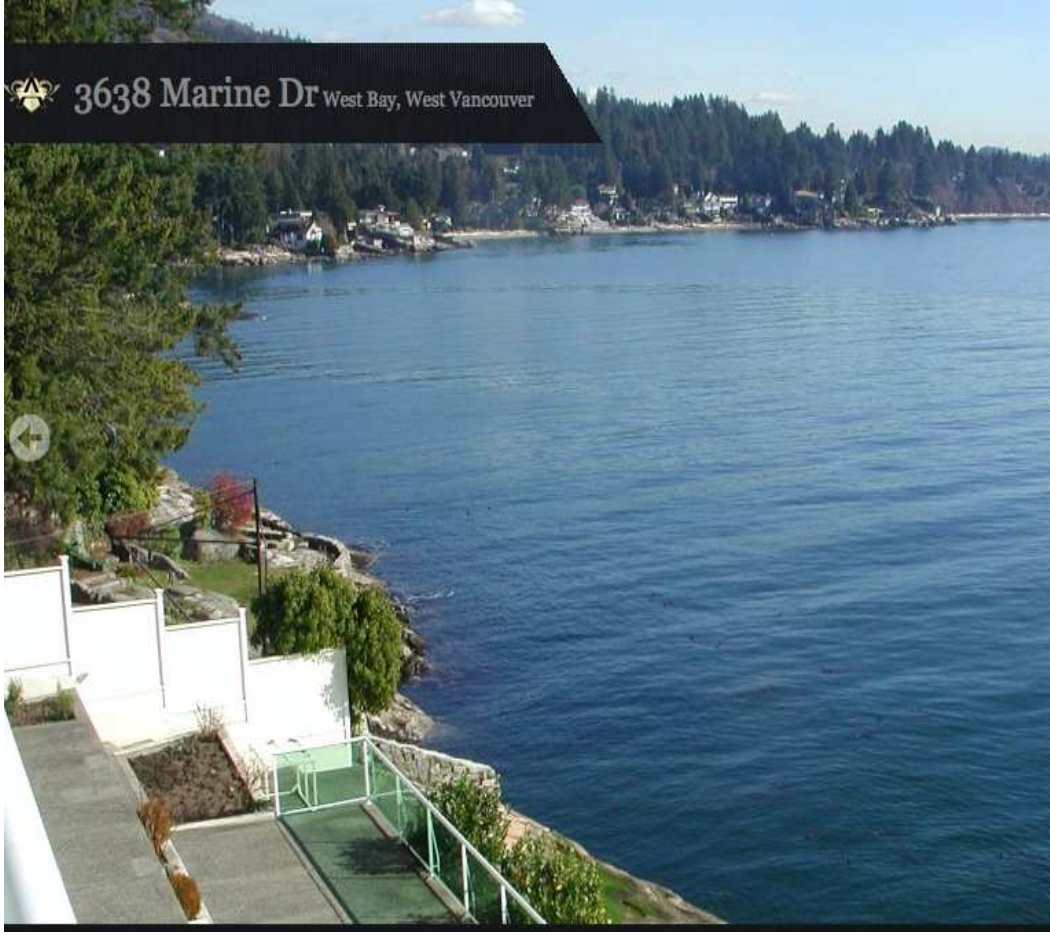
ویلا در ونکوور