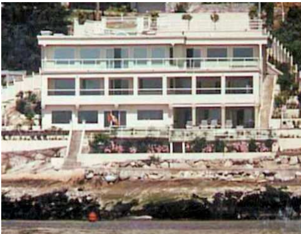
یکی از ویلاها