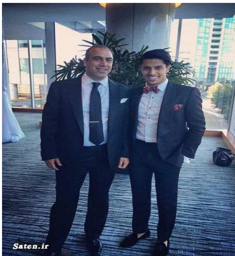
پدر و پسر