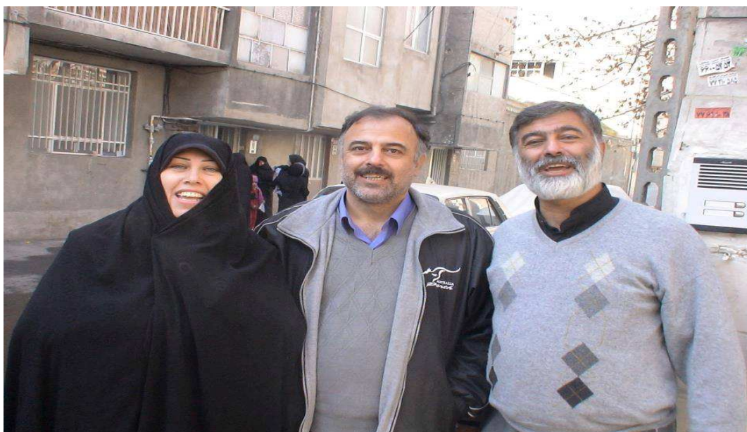
اعضای خانواده مکتبی احمدی نیری