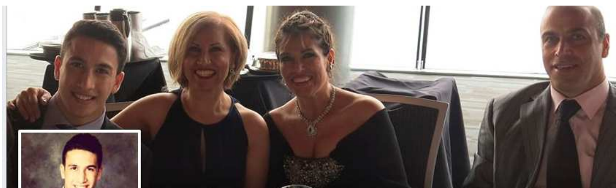
برادر مکتبی همراه زن و خواهر زن خود که همسر سردار سپاه