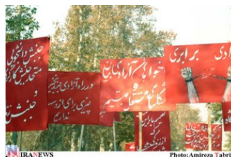
بیانیه ی دانشجویان چپ دانشگاه های تهران

(*) اخیراً در نیبلی، بعد از پیروزی خانم باشلت، حق سقط جنین آزاد با وجود مخالفت های شدید کلیسا، به رسمیت شناخته شده است.